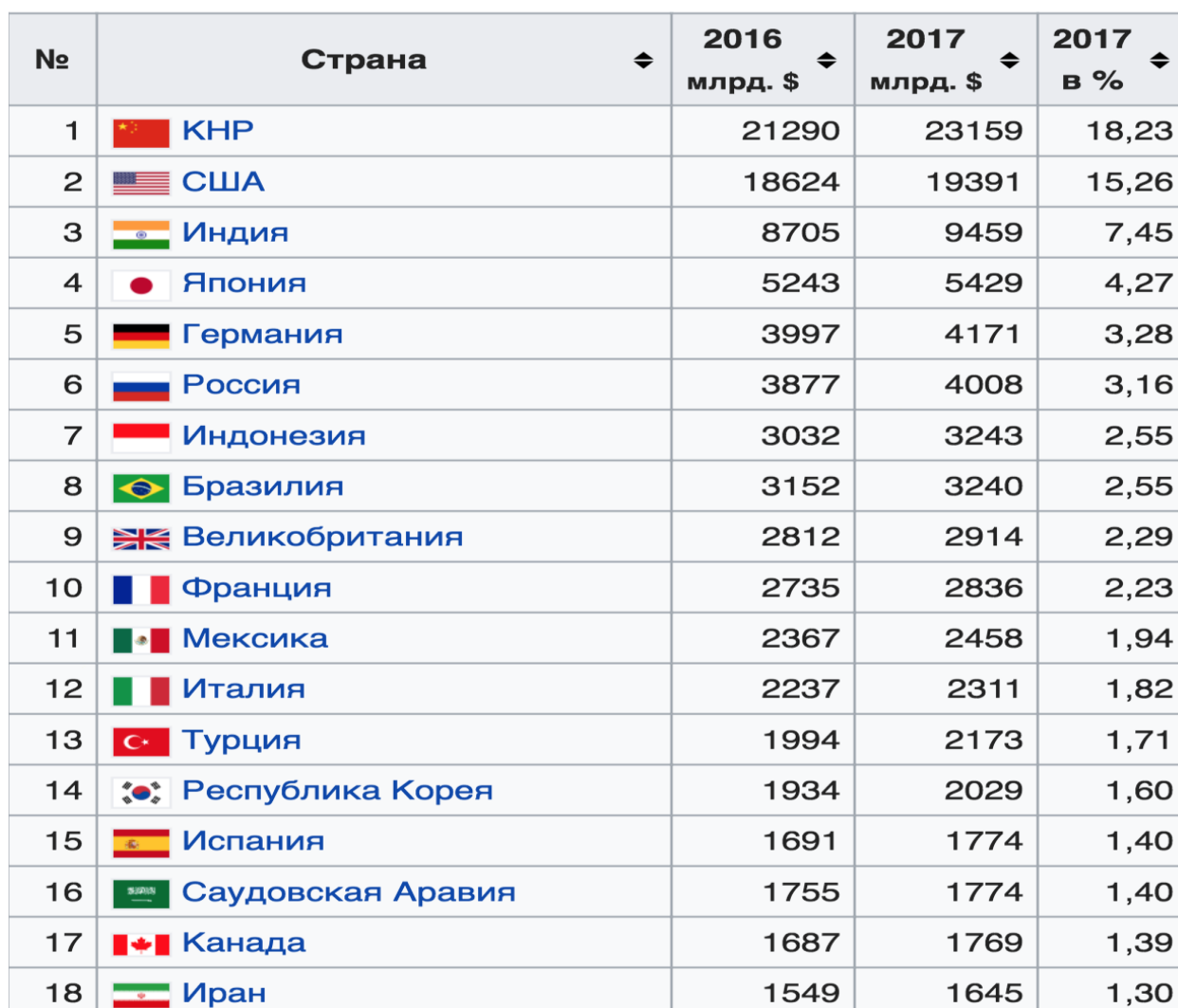
Рисунок 2. Рейтинг стран по ВВП согласно подсчётам Международного валютного фонда

является, то, что он не отвечает на главный вопрос для экономики и населения в целом: богатеет со временем данная страна, или, наоборот, беднеет.